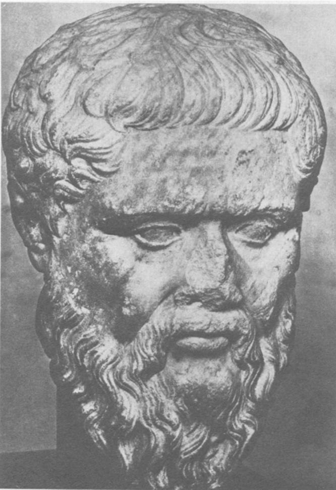
Platon (428/27–348/7 vor Chr.), Athen. Überlebensgroße Marmorbüste aus schweizerischem Privatbesitz.

Wir wollen jetzt wieder den Blick auf die heutige Physik werfen. Die neuzeitli-